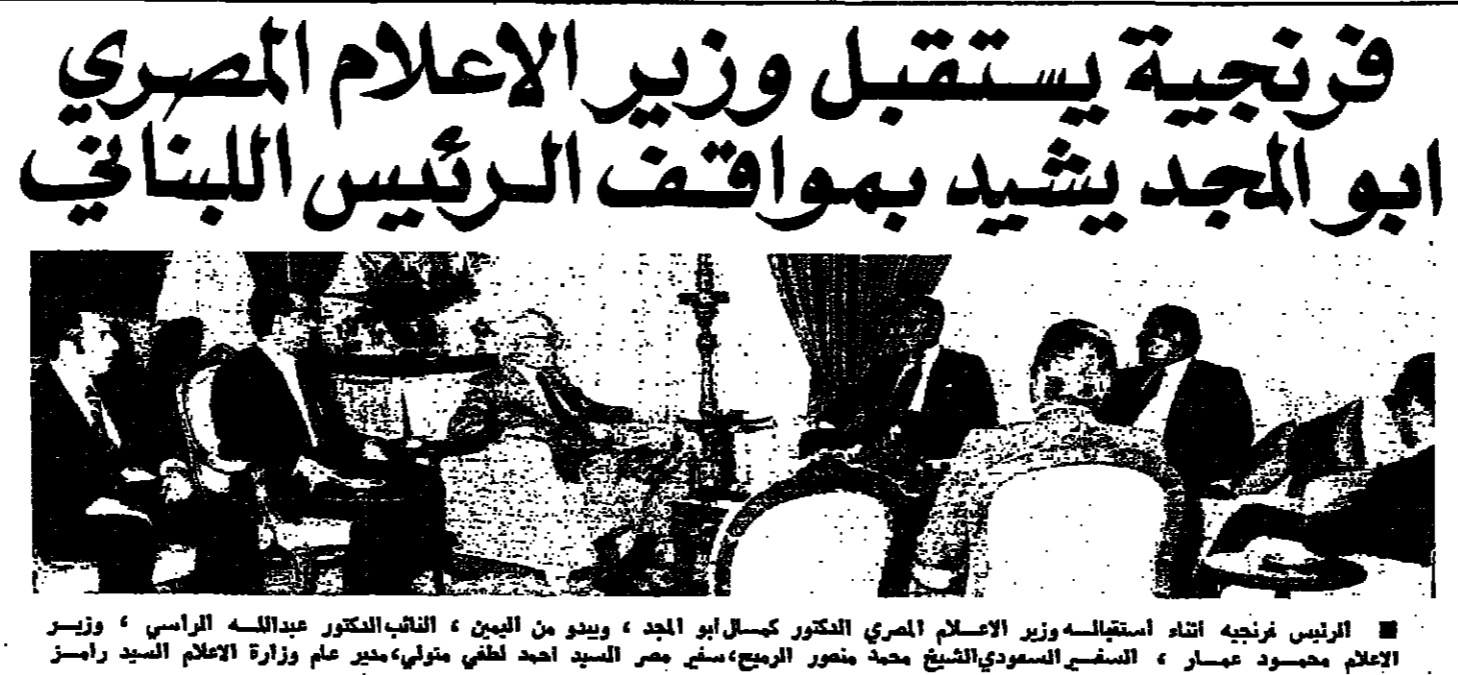
الرئيس فرنجيبة استقبل وزير الاعلام المصري الدكتور كمال ابو الجند ، ويبدو من البيان ، والنائب الدكتور مبدالله الراسي ، وزير الاعلام محمود عيسر ، السفير السعودي الشيخ محمد منصور الربيع، مدير عام وزارة الاعلام السيد رامز خزن